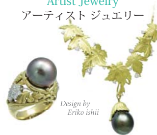
Design by Eriko ishii