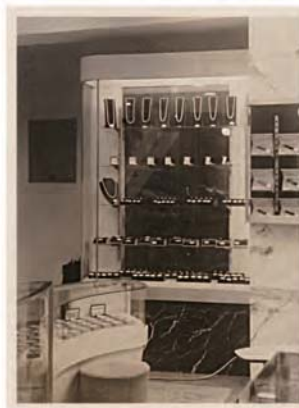
↑ 大島宝飾店前にて ↓ 店内の様子

「馬車道の大島宝飾店」 昭和二十九年に馬車道商栄ビルが建てられて、父が今の「横濱宝石美術館エメラ」がある場所で「大島宝飾店」をオープンしました。祖母の遺品の中から奇跡的にその頃の写真が見つかったのでご紹介いたします。 上の写真は『OSHIMA JEWELS 大島宝飾店』と書かれたショーウィンドウの前に当時働いていた二人の女性が並んで写っています。今でも父が「大理石でショーウィンドウは一枚ガラスだった」と自慢いたしますが、その気持ちがかかる、当時としてはモダンな店構えでした。 下は店内の写真ですが、パールのネックレス、指輪や時計が美しく並んでいます。外国人のお客様が多かったこともあり、宝飾やディスプレイにも異国情緒の薫りが漂ってくる貴重な写真です。