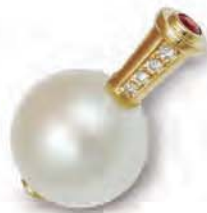
表紙/パールのコマ