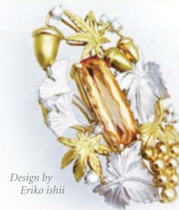
Design by Eriko ishii

ご予約頂くと、ゆっくりご相談できます。 デザイナーが直接お話を伺うこともできます。 ご来店を心よりお待ちしております。