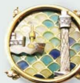
マリントワーと水川丸 ¥340,000 K18/K18WG/ダイヤモンド 透胎七宝