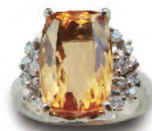
¥1,250,000 インベリアルトパス7.28ct Dia 0.30ct Pt.900

イエローは「自分」というキーワードを持っていて、自分自身がどう在りたいかという事を教えてくれる色です。何に向かって進んで行ったらいいかわからない時や、自分の言葉に勇気が持てないような時に身に付けるといいでしょう。イエローを身に付けて、明るくポジティブな気持ちになったら、目標やゴールを頭上高く設定し、それに向かって自分らしく進んで行きましょう！